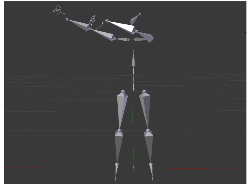
Posture à estimer